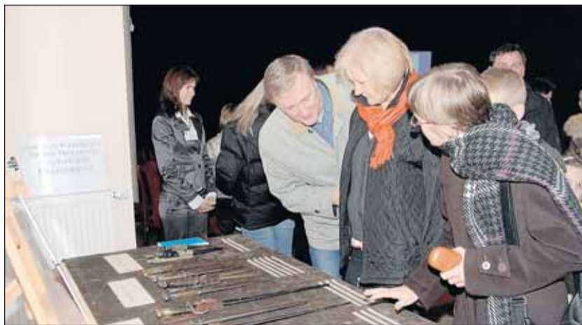
Wystawa w GOK - zbiory bagnetów od 1914 r. - 1945 r.