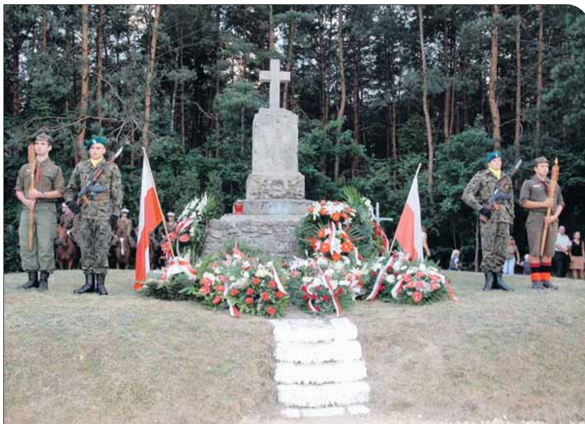
Pomnik Strzelców Kaniowskich w Wólce Radzyńskiej