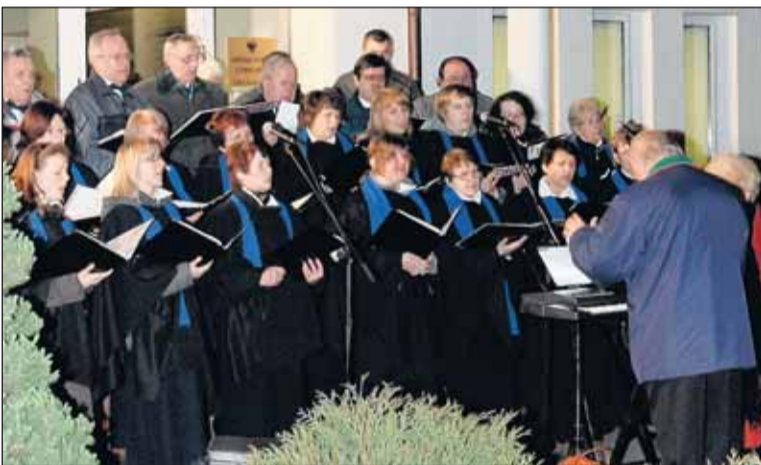
Chór „Echo” z Wołomina