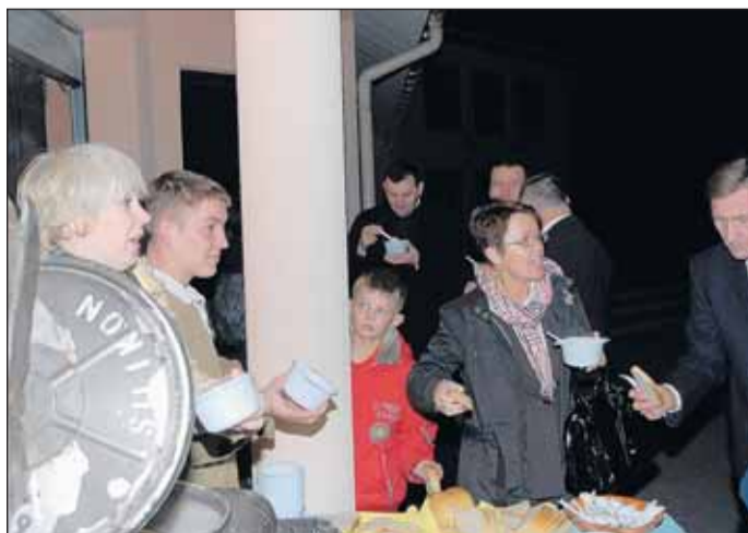
Grochówka przed Cafe Garaż