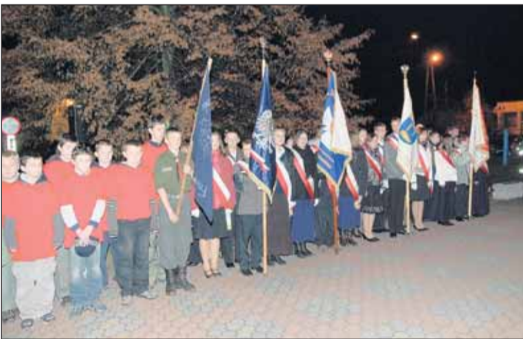
Harcerski oraz szkolne poczty sztandarowe