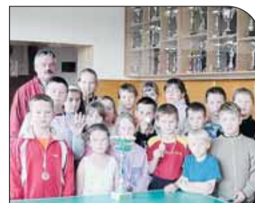
Zwycięska drużyna ze Szkoły Podstawowej w Białobrzegach

Mieszkańcom gratulujemy udanej współpracy z ośrodkiem, a jego pracownikom życzymy wielu jeszcze udanych imprez. □ Beata Wilk