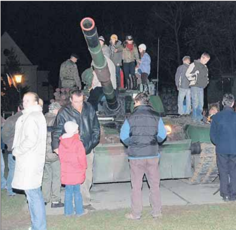
Czołg PT-91 Twardy