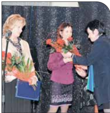
Podziękowania dla pracowników ośrodka