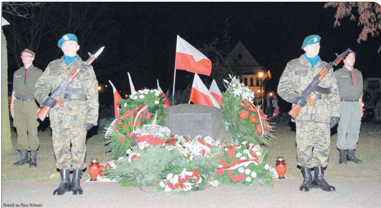
Pomnik na Placu Wolności

W programie: 12.00 – Msza św. w kościele N.M.P. Wspomożycielki Wiernych w Stanisławowie Pierwszym 13.00 – uroczyste otwarcie mostu połączone ze spotkaniem integracyjnym mieszkańców, władz samorządowych powiatu i gminy