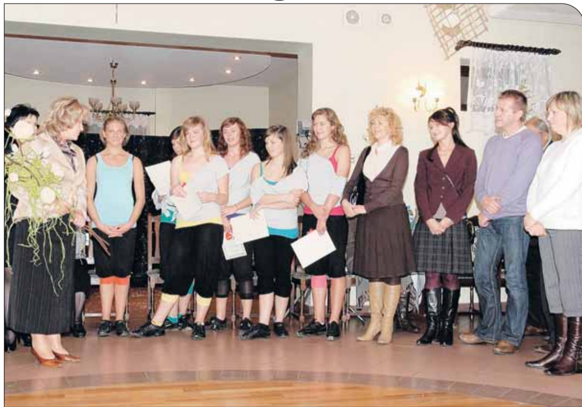
Podziękowania dla zespołu Batocado i rodziców

W niedzielę (23.XI) w Filii GOK w Stanisławowie Drugim świętowano jubileusz 10-lecia istnienia ośrodka.