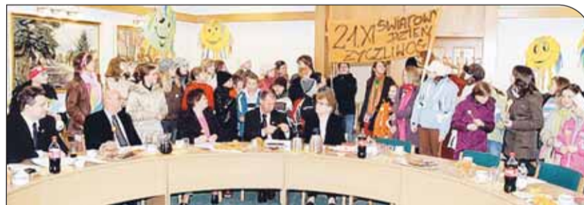
Spotkanie z uczniami

W spotkaniu uczestniczyli przedstawiciele wszystkich gmin powiatu legionowskiego oraz starostwa. Omawiano przede wszystkim problemy samorządowej polityki oświatowej, nawiązując także do toczącej się w kraju debaty. Wiele czasu poświęcono zagadnieniom dodatków funkcyjnych i motywacyjnych, zasadom ich przyznawania i regulowania wysokości. Zebrani byli zgodni, że nadrzędnym celem samorządów jest osiągnięcie jak najwyższego poziomu nauczania w placówkach. Konsultowano również sposoby realizowania obowiązku dowozu dzieci do szkół, wypracowane przez poszczególne jednostki.