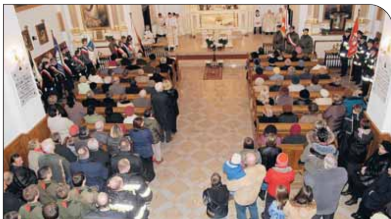
Msza św. w kościele parafialnym w Nieporęciu