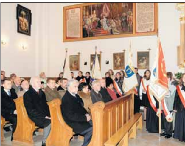
Msza św. w kościele parafialnym w Nieporęcie