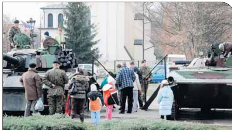
Prezentacja pojazdów militarnych