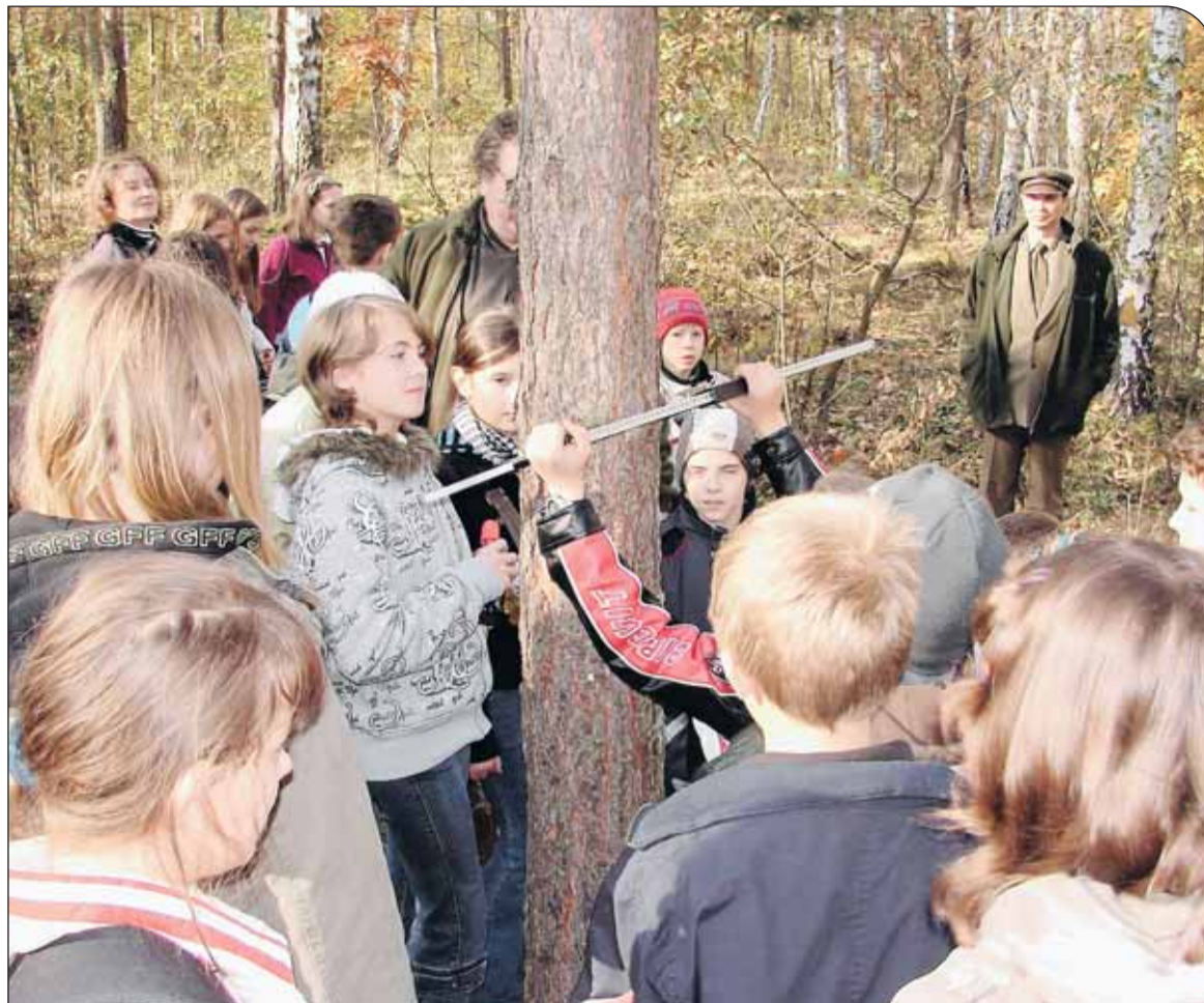
Wizyta w lesie