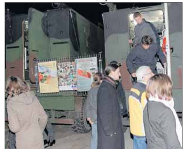
Akcja promocyjno-informacyjna 9. batalionu łączności w Białobrzegach