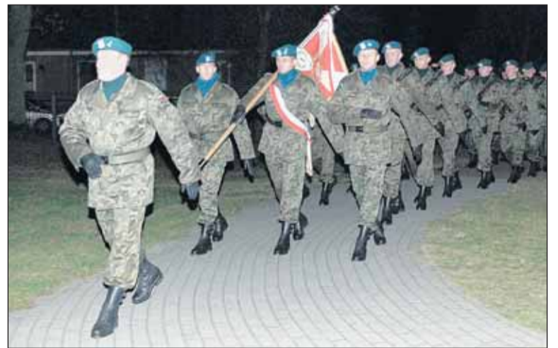
Kompania Honorowa I Legionowskiego batalionu zaopatrzenia