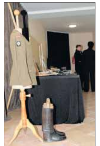
Kurtka mundurowa mjra Włodzimierza Detloffa